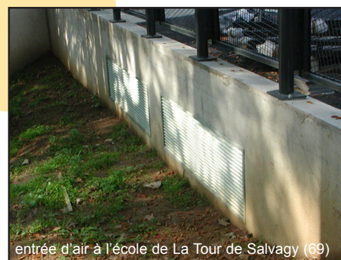
entrée d'air à l'école de La Tour de Salvagy (69)

fraîcheur en été par rapport à la température extérieure ce qui correspond à une puissance de froid de 55kW tandis que pendant la saison froide la différence de température en faveur du bâtiment s'élève à +17°C ce qui concorde avec une économie en terme de puissance de chauffe de 65KW.